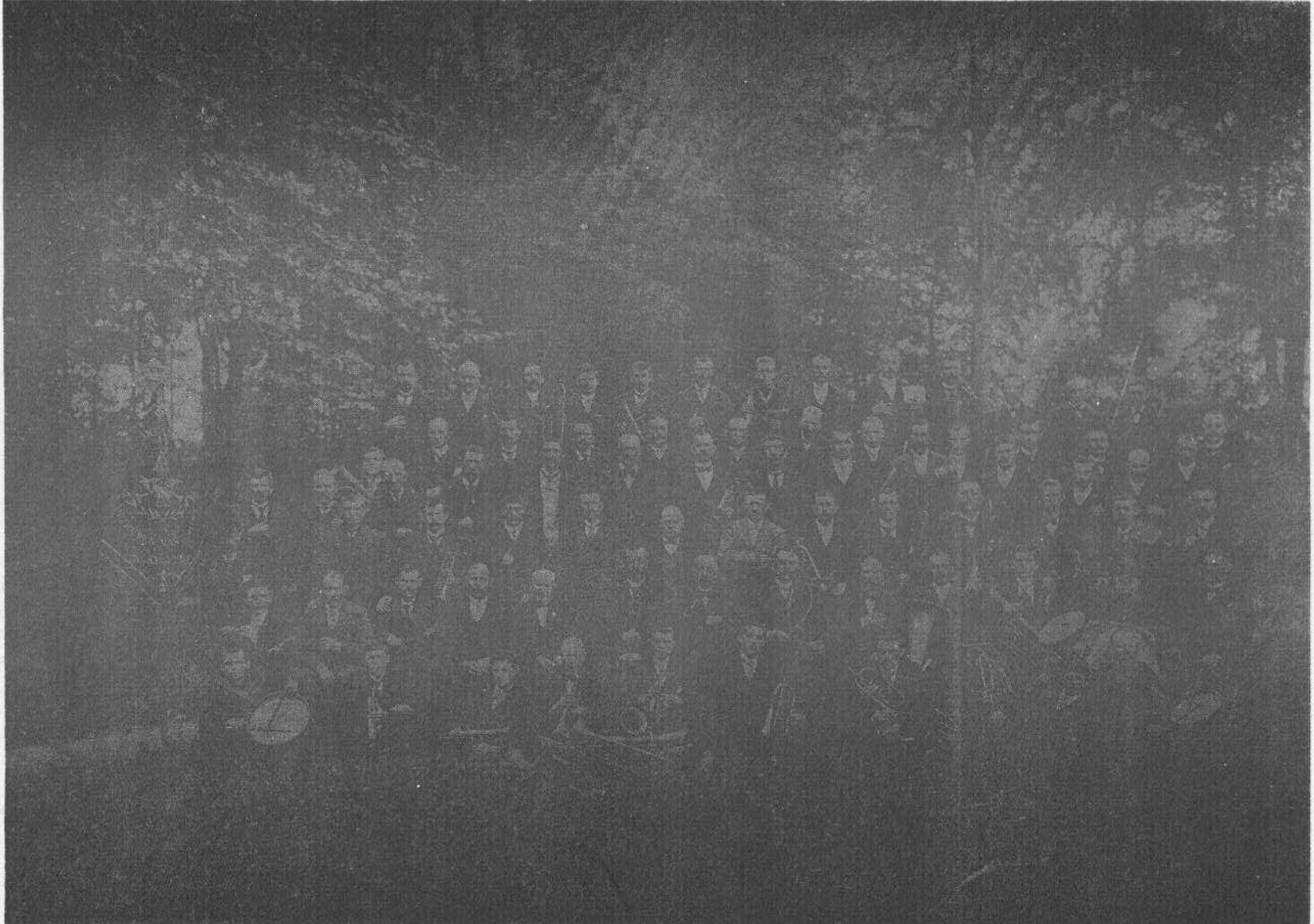
De Vrienden van 't Recht in 1911