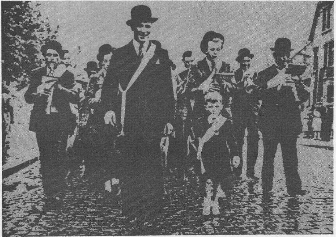
De Vrienden van 't Recht