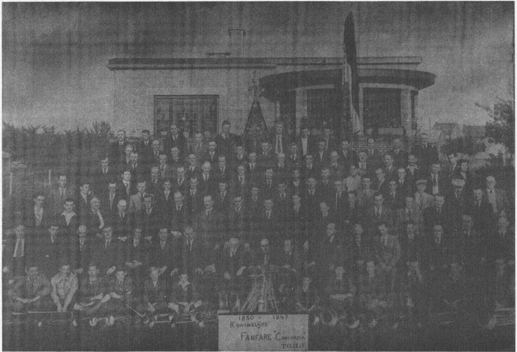
De Kon. Fanfare Concordia in 1947