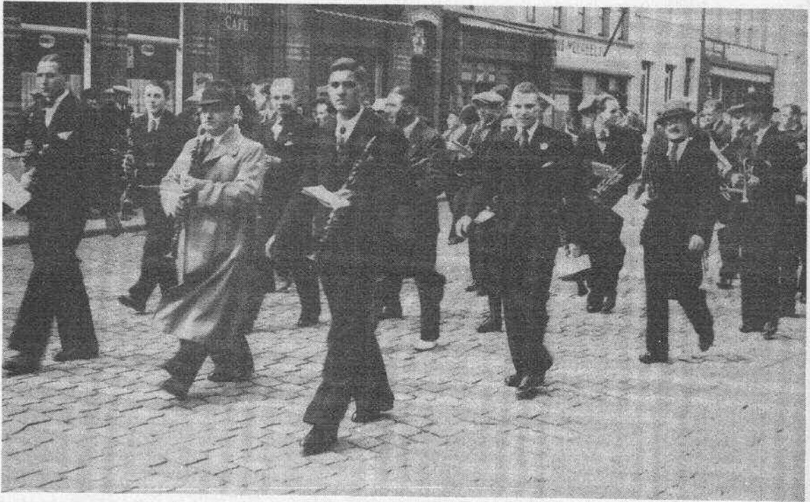
De harmonie in vroegere tijden, toen ze nog fanfare was