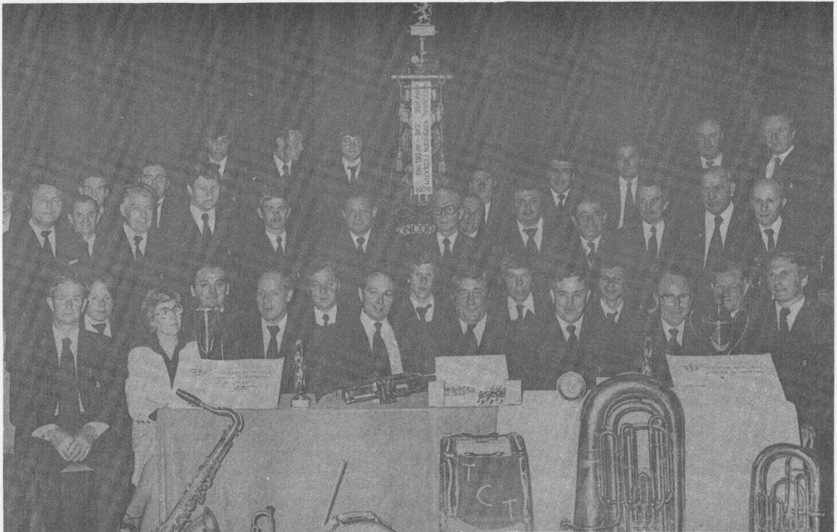
De Kon. Fanfare Concordia werd Provinciaal Kampioen in 1976