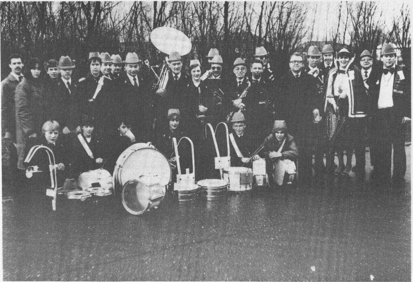
De harmonie op stap in 1984