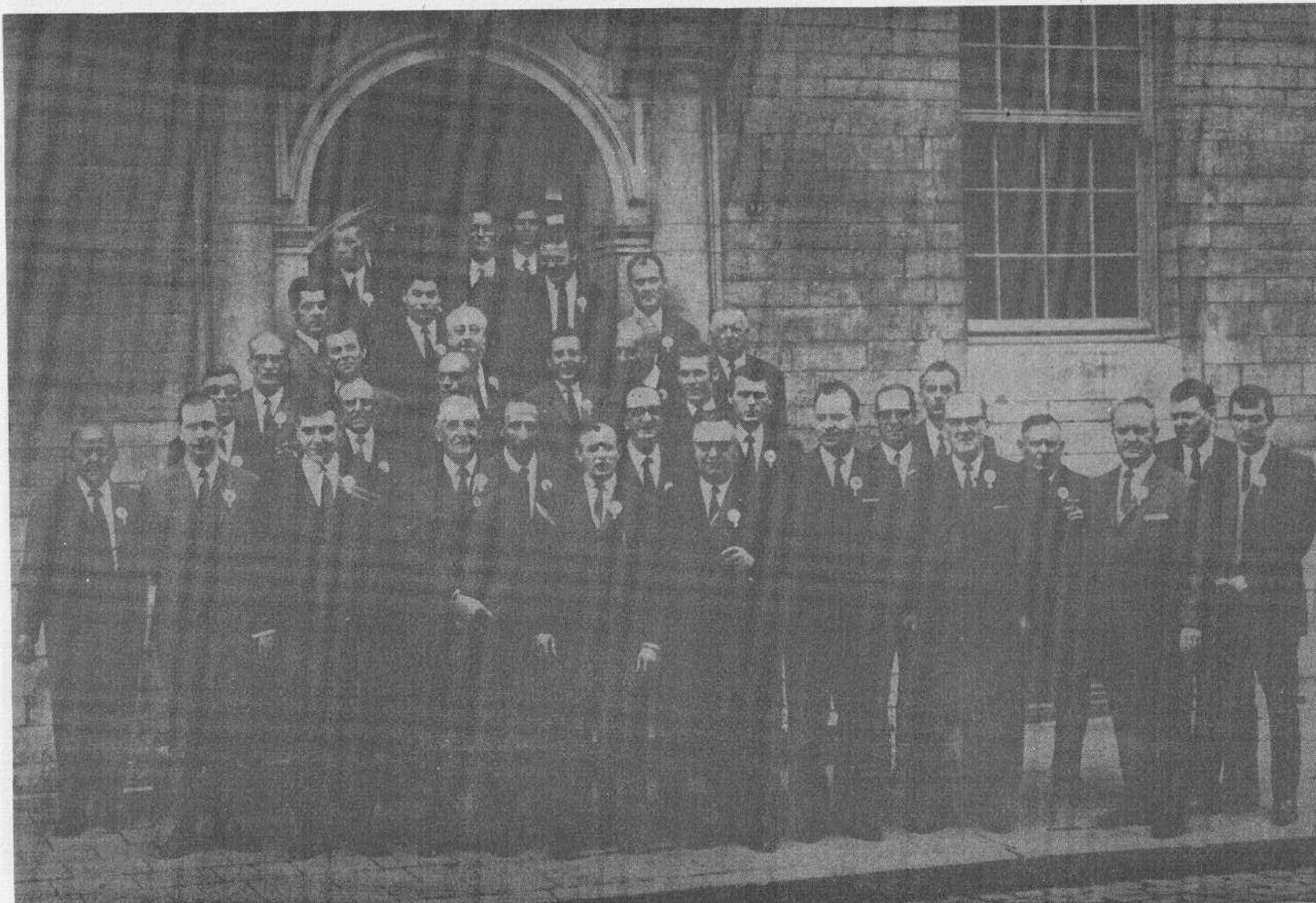
De harmonie tijdens haar ontvangst op het gemeentehuis, in 1969, naar aanleiding van haar 60-jarig bestaan