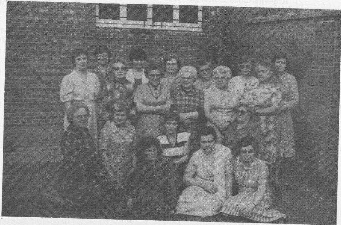
Het K.A.V.-bestuur in 1984.