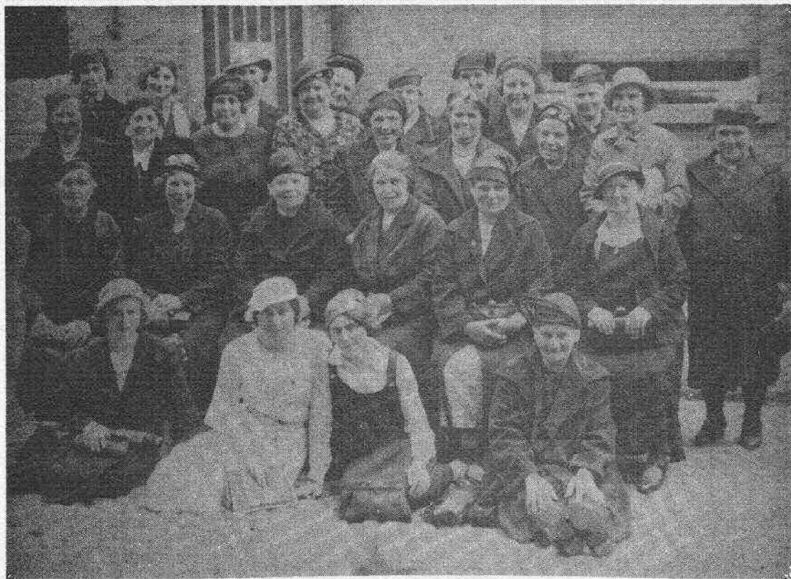
K.A.V. H.-Familie, in de beginperiode.