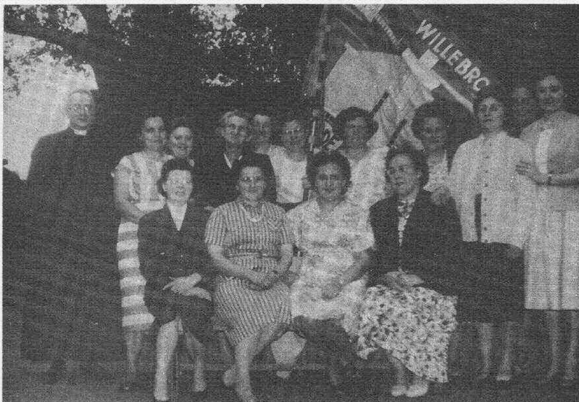
In 1959 werd het 25-jarig bestaan gevierd met ondermeer de wijding van de nieuwe vlag.