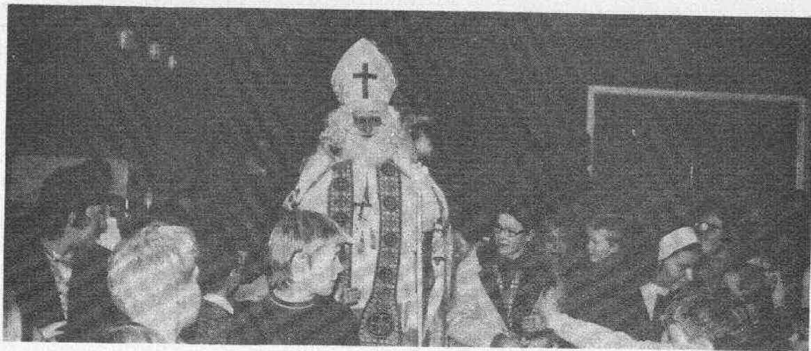
Sint-Niklaas tijdens z'n blijde intrede.