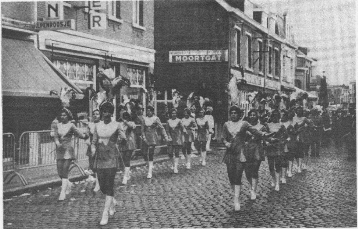
Het Majoretten- en Trommelkorps geeft de pas aan