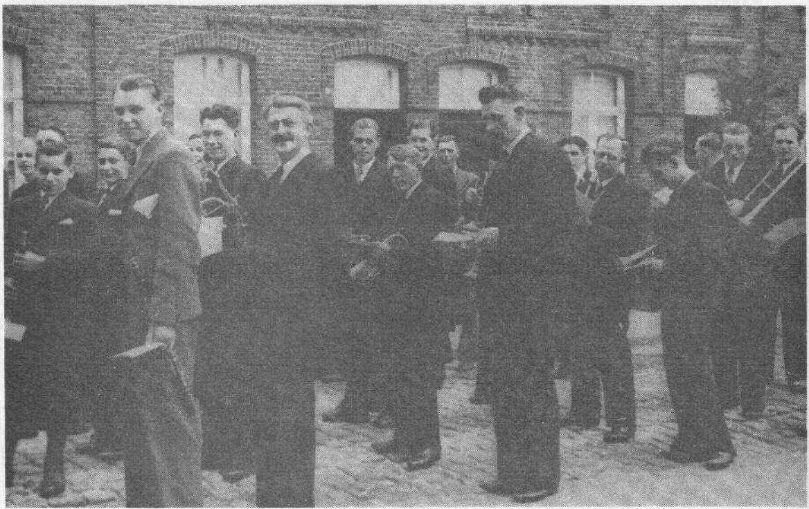
De harmonie op stap

Bezoekers van de school van de vereniging in 1917 Overgenomen van het "Nieuwspaper" van de vereniging in 1917. Het is een groep van jongeren van de school van de vereniging in 1917. De foto is genomen van de school van de vereniging in 1917. De foto is genomen van de school van de vereniging in 1917.