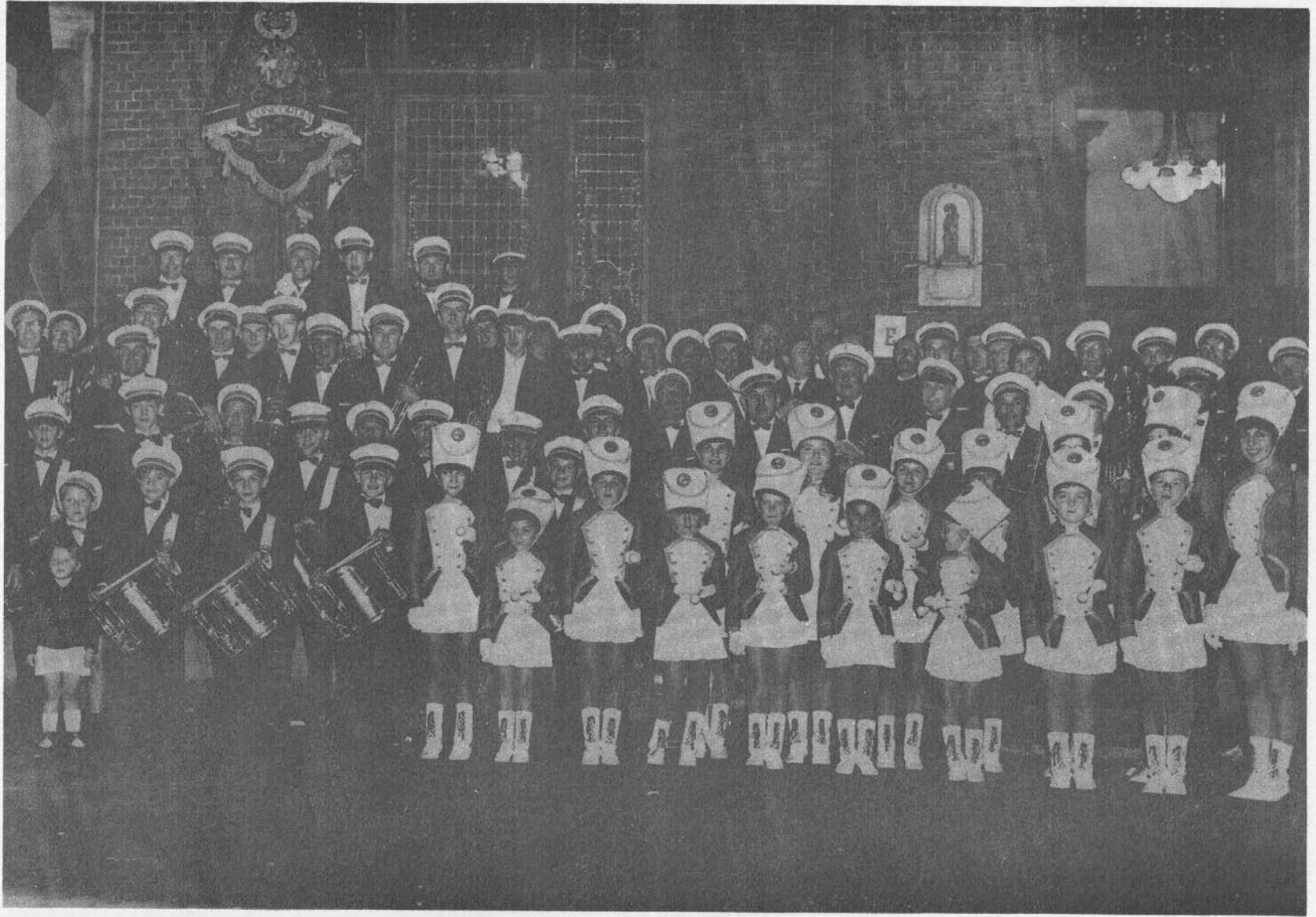
Samen met het Majoretten- en Trommelkorps te Izegem in 1969