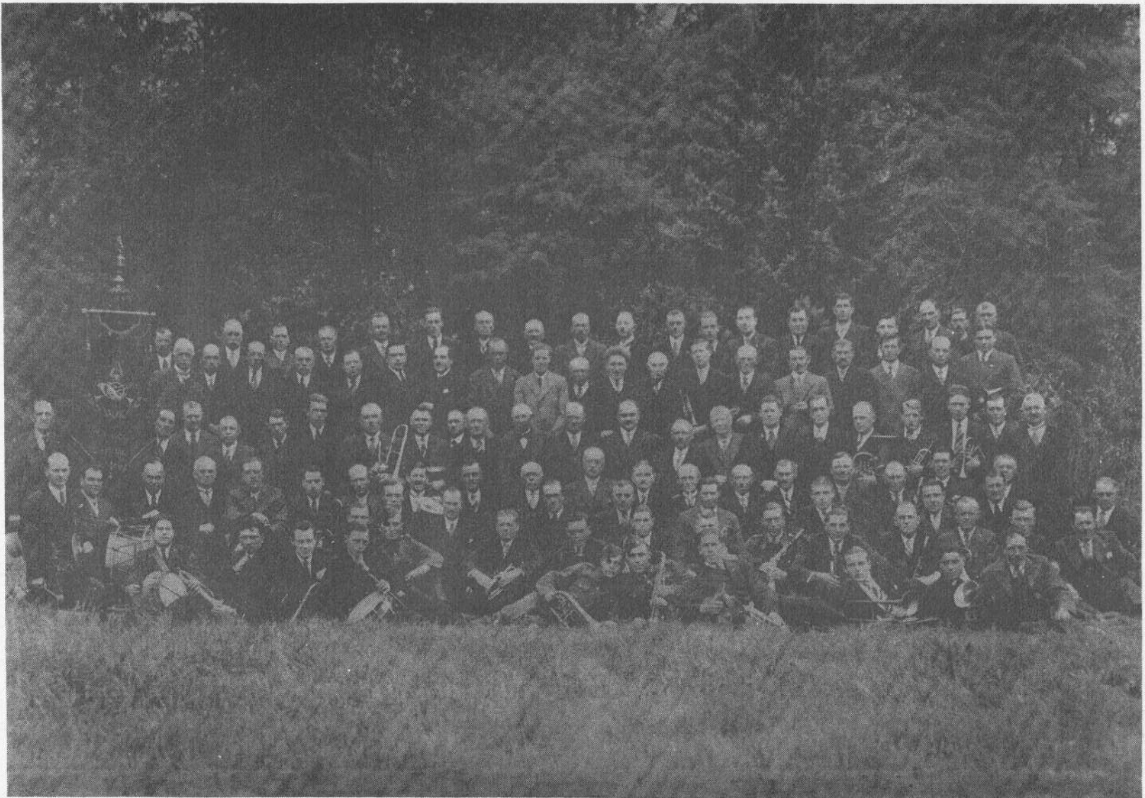
De Vrienden van 't Recht in 1935