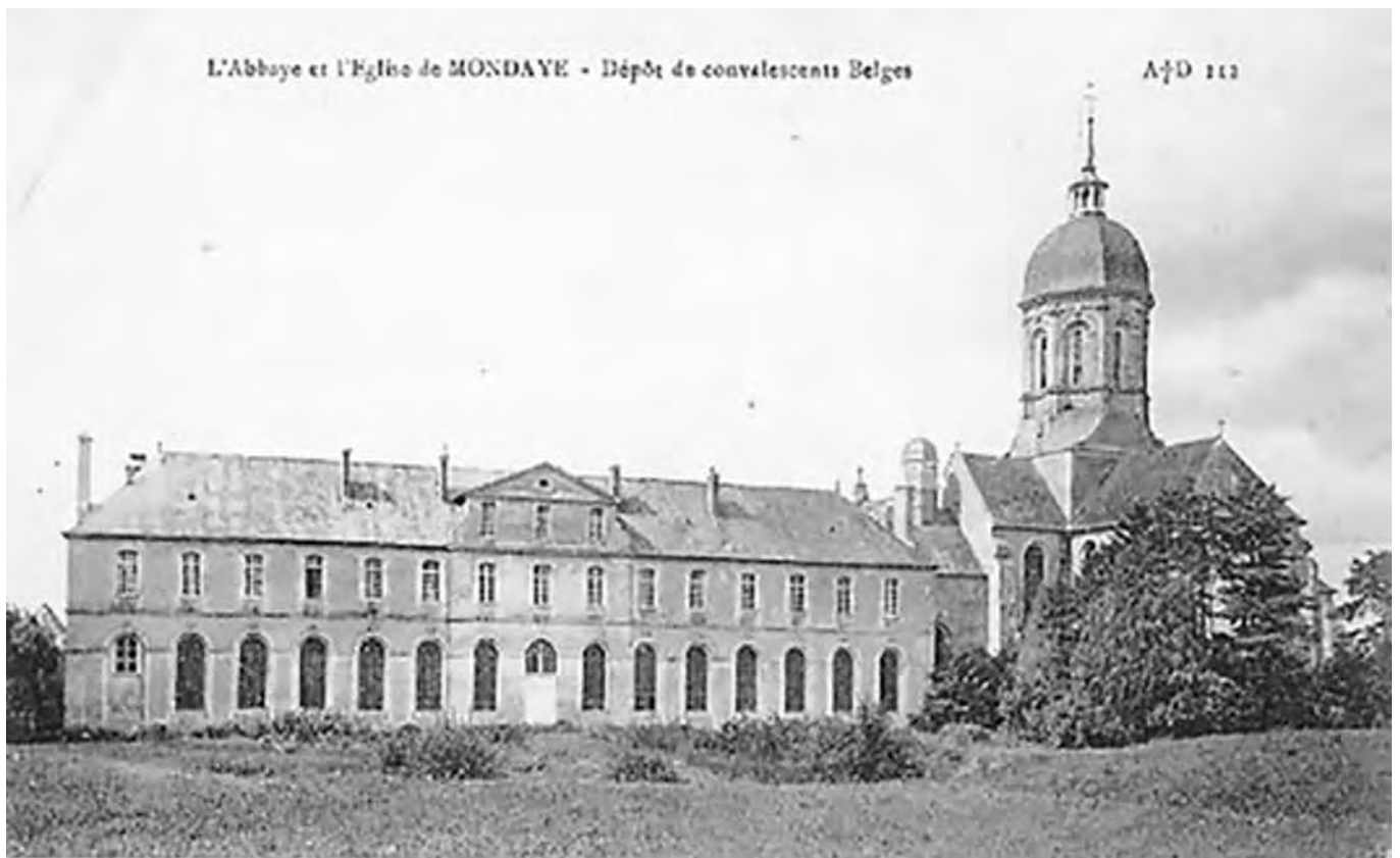
De abdij en de kerk van Mondaye, in de buurt van Bayeux. Gekwetste Belgische soldaten werden er ondergebracht voor een herstelperiode die soms maanden kon duren

Wanneer ik het hospitaal verlaat, is het om dienst te nemen in de rug van het leger en niet langer op het front achteruit. Het is een herhaling en de bevestiging van wat hij de maand voordien schreef. Hij gaat er trouwens van uit dat zijn wonde nog een geluk is, zodat zijn ouders nu niet langer in achterdocht moeten leven.